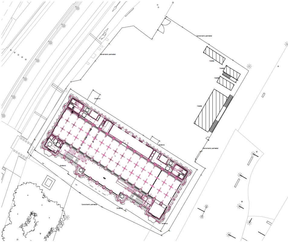
Emplazamiento cerramiento y campa actuales.